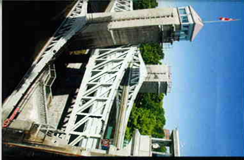
左ビーターボロにあるリノックの水圧式昇降機門、水位の高低差19.8mというのは、このタイプでは世界一で推力満点

何よりもうれしいのは、カナダでは今回憶り た々々の船舶には特別な免許がいらないとい うこと（乗艇に必要な条件は25歳以上であるこ と、国際運転免許証の提示が不要）。つまり、手 慣れボートにもとまらなくていいのだから、私でも自 ら操縦して旅ができるのです。もちろん、出発 前には基本的な操作を教してもらいます。まず は、ボートを使った説明を受け、そのあと停泊時 のロープの巻き方など気を付けるべきボート トを要領。あとはレジャーを愉しむのと同じ ようなエンジンで手続をするだけ。初めての 体験に気が入りまくりました。この日も、拍 子抜けしてしまえばエンジン。あとこの1週間 に出発し、気がつけば船上でボートを操縦して いる自分がいるのです。