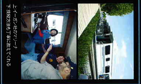
イーガン社のワナワナ下流線の方まで丁寧に教えてくれる