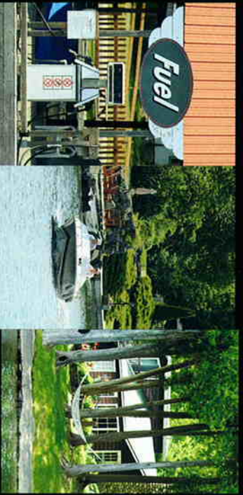
左水路の上には給油所や私設ターボも 中ボートクルーズは、まさに今がシーズン 右水路沿いには大きなコテージが、つばい、魅力的なハイモックを見