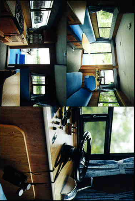
右側はハンドルで、右側のシフトを倒せば前進、手前に倒せば後進、と操作もシンプル 左上ボート内前方、エンジンの部分を倒せば、フロントエンジン 左下ボート内後方、大きな発電機や冷却機もあるエンジン