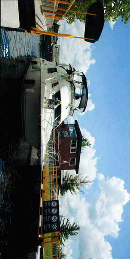
ターボでのレジャーの場合は、エンジンの運行状況や油圧などを監視している