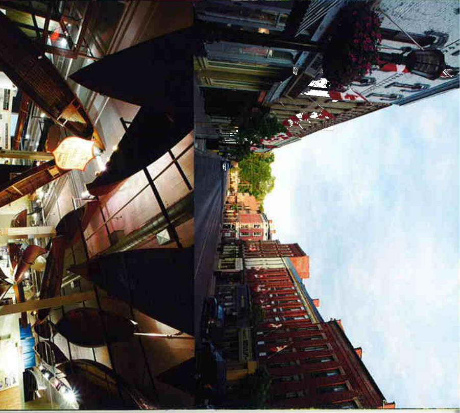
左上(狭小)の地のいいワナのあるカワエでほっぺー島(ボクアイゼン) 右上お昼飯にびっぴりな海鮮(フエネロンフオーニス) 左下(狭小)の地にもなっているフエネロン湖(フエネロンフオーニス) 右下途中、朝食のいい188留宿舎を組み合わせたのもオヌヌス(ボートホーク)